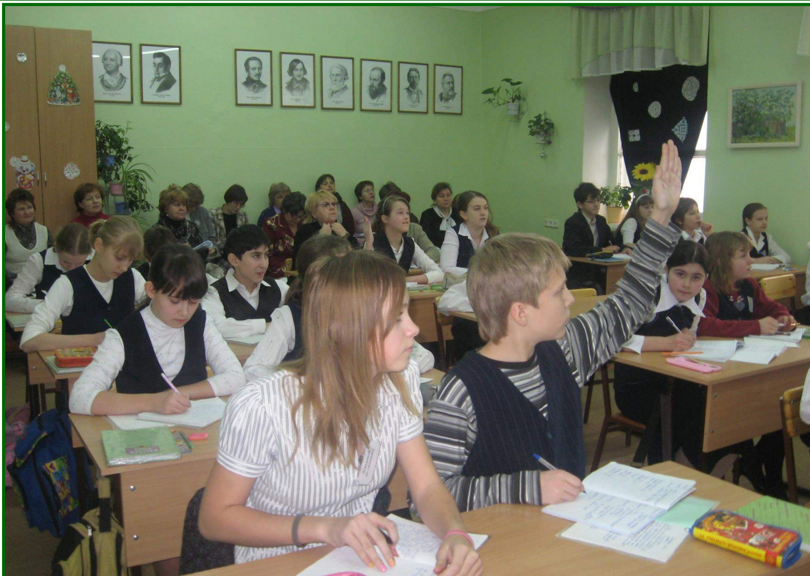
Урок русского языка в 7 классе