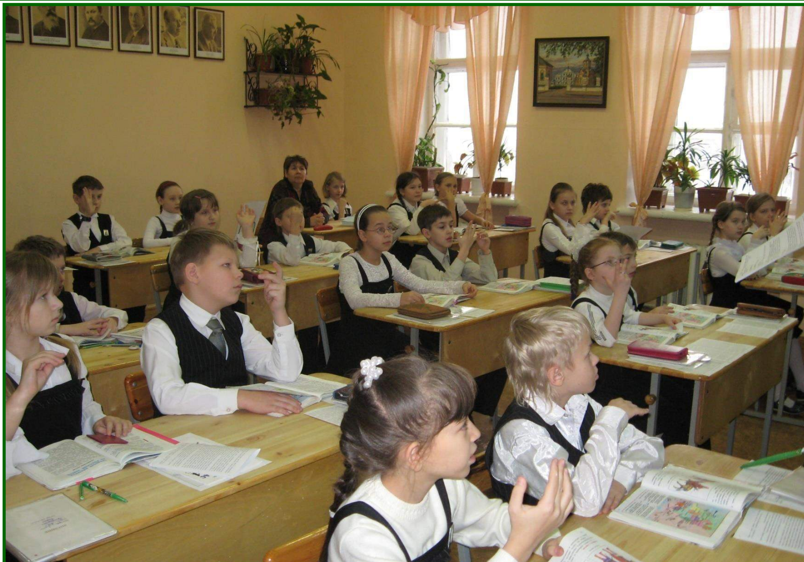
Урок истории в 4 классе