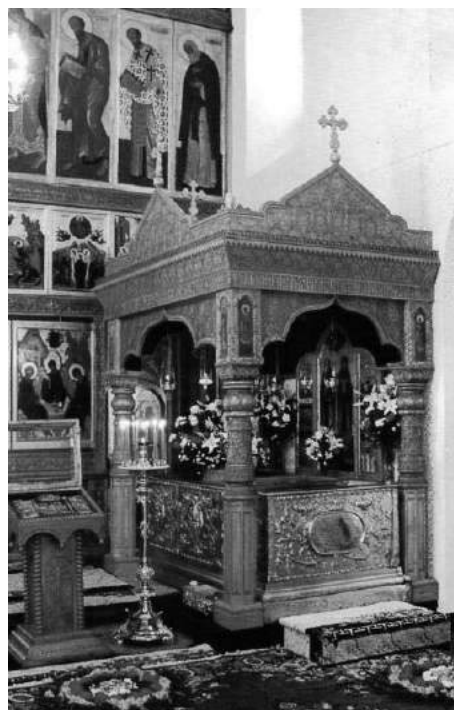
На фото: рака с мощами преподобных Петра и Февронии Муромских в Свято-Троицком монастыре г. Муром

Этот новый для россиян праздник в 2008-2010 годах широко отмечался во многих городах: проводились массовые торжественные церемонии бракосочетания и праздничные мероприятия с трансляцией по центральному телеканалу России. В 2008 году даже началась кампания по установке памятников Петру и Февронии в российских городах.