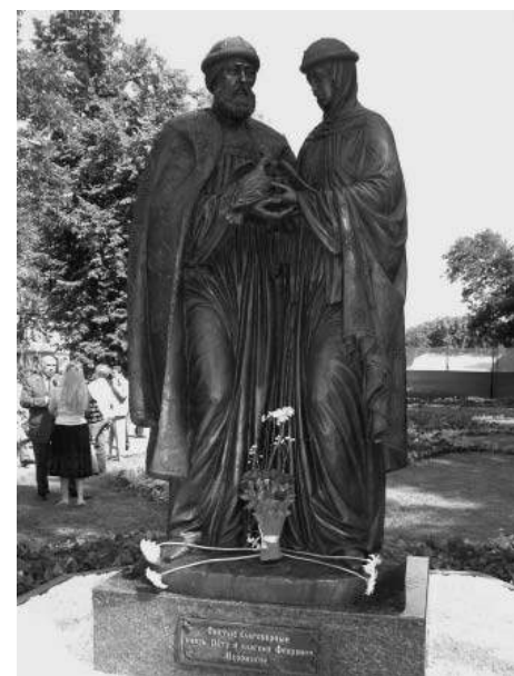
На фото: памятник Петру и Февронии в г. Абакане.

нас любить всех, быть кроткими, верить в Господа Бога, любить свою Родину и заботиться о своих ближних.