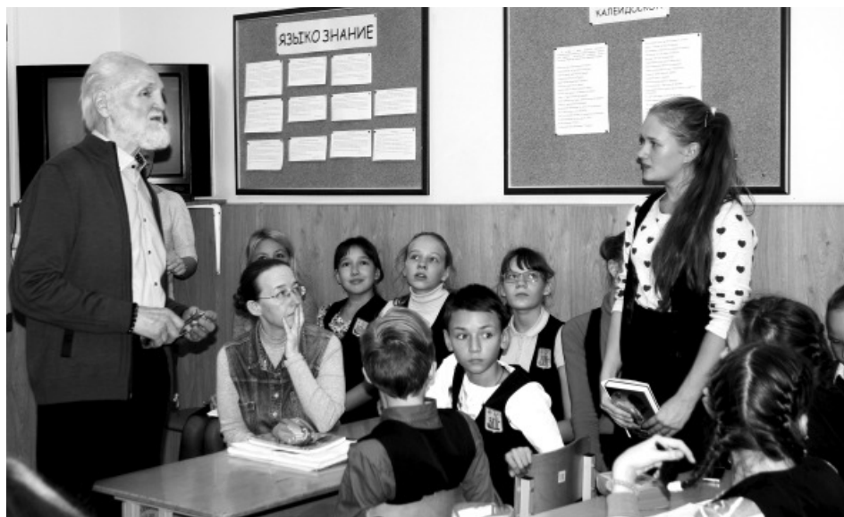
Гимназисты активно задавали В.Н. Крупину вопросы